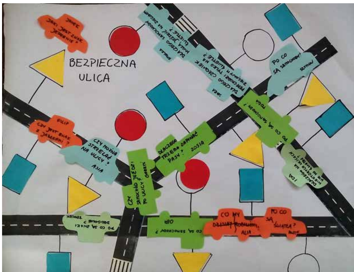
Zapytajki – bezpieczna ulica

bardziej opaste i ustrukturalizowane, a powszechnie dostępne scenariusze zajęć zwalniały nauczycieli z wysiłku tworzenia, zauważyłam, że konkretne dziecko i jego nauczyciel zatracają swoją indywidualność. Poza tym koncentracja na realizacji zadanych przez podstawę programową treści kłóci się z troską o indywidualny rozwój poszczególnych dzieci. Postawiłam sobie pytanie: wokół czego organizować zajęcia z dziećmi, by podążać za nimi, by stymulować ich rozwój, by nie hamować, lecz rozbudzać ich ciekawość?