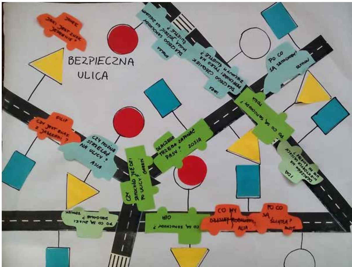
Zapytajki – bezpieczna ulica

bardziej opaste i ustrukturalizowane, a powszechnie dostępne scenariusze zajęć zwalniały nauczycieli z wysiłku tworzenia, zauważyłam, że konkretne dziecko i jego nauczyciel zatracają swoją indywidualność. Poza tym koncentracja na realizacji zadanych przez podstawę programową treści kłóci się z troską o indywidualny rozwój poszczególnych dzieci. Postawiłam sobie pytanie: wokół czego organizować zajęcia z dziećmi, by podążać za nimi, by stymulować ich rozwój, by nie hamować, lecz rozbudzać ich ciekawość?